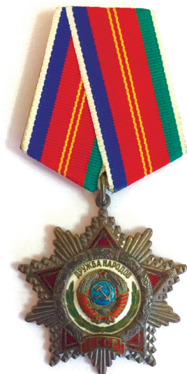
Рисунок 9. Орден Дружбы народов.